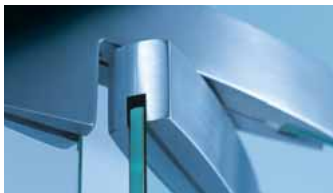
Glass Fittings and Accessories